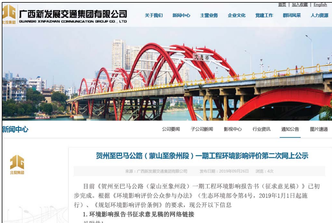
图3.2-1 第二次网上公示截图

网站公示: 广西新发展交通集团有限公司网站 ( http://www.gxxfz.com )。