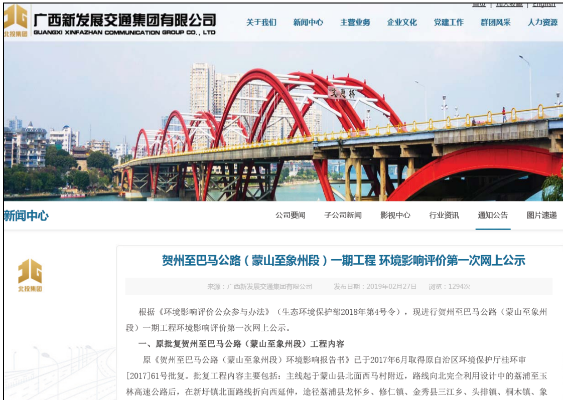
图2.1-1 第一次网上公示截图